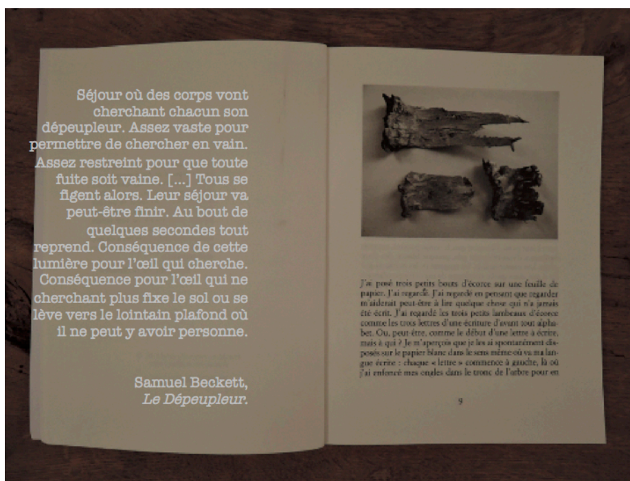
“Écorces, Georges Didi-Huberman” (Les Éditions de Minuit, 2011, pp. “7”, 8-9)