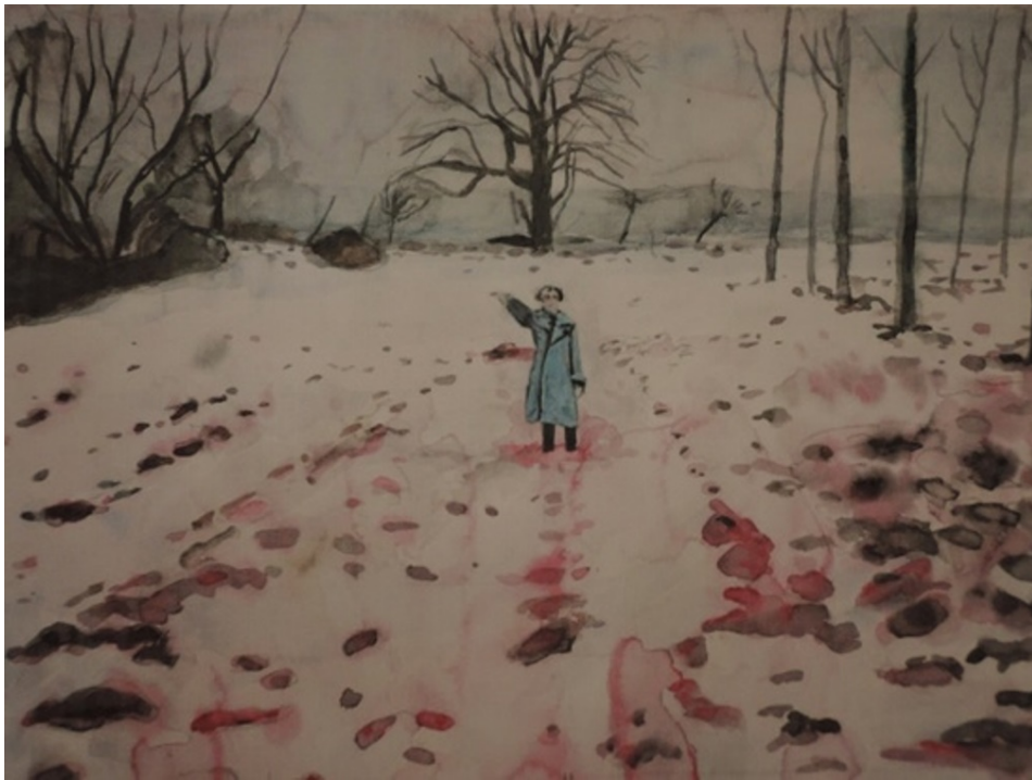
Anselm Kiefer : Eis und Blut (Glace et sang), 1971. (coll. particulière, Allemagne)