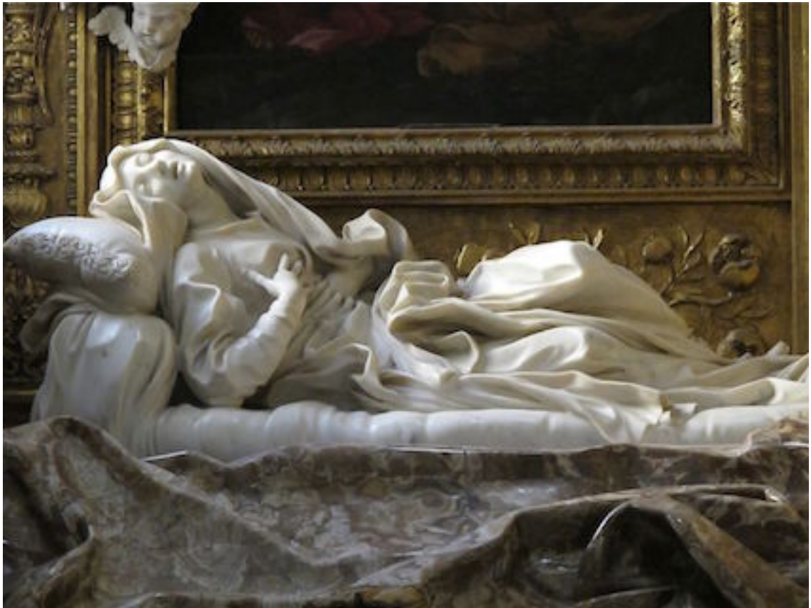
Eglise San Francisco à Ripa, à Rome, dans une des chapelles : la bienheureuse Ludovica Albertoni, un des joyaux de la sculpture baroque du Bernin